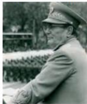
voditelj, tovariš Tito