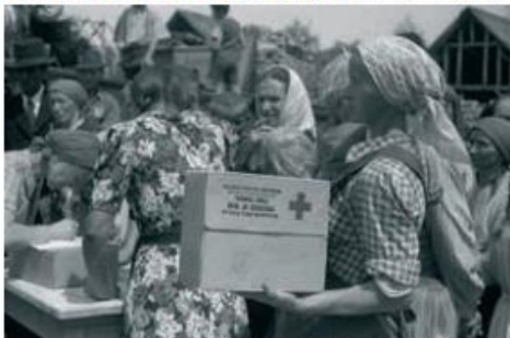
Delitev zahodne pomoči prebivalcem Slovenije

1. Preberi odlomek in si oglej fotografijo, nato odgovori na vprašanja.