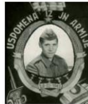
vojska - JLA